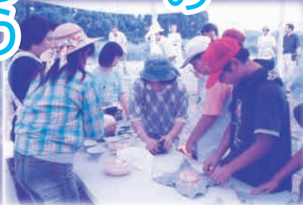
▲朴の葉ごはん作り体験