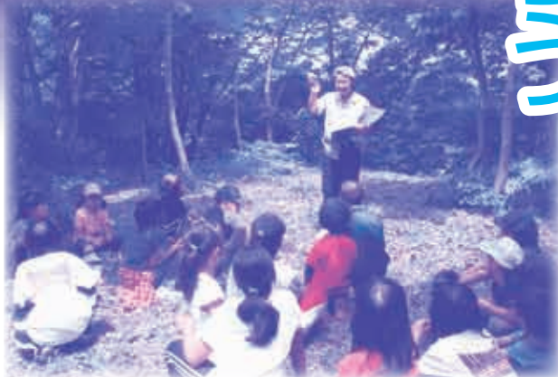
▲ネイチャーゲーム

私達ふるさと山の会は、多くの 人々が春から秋まで、この里山に 足を運んでもらえる花いっぱい 森に育て、希少動植物の生息でき る環境整備活動を行い、宝の山と して後世に残したいと考えていま す。